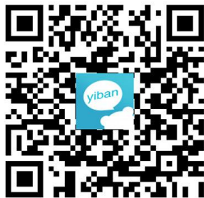
扫二维码下载最新 易班手机客户端